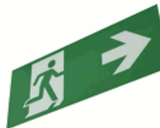
ACC. PICTO. DIANA FLAT HOMBRE + FLECHA DERECHA