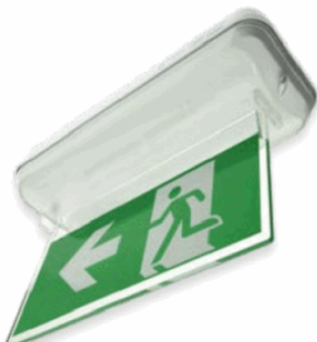
ACC. DIF. BANDE. ARIAN BLANCO SIN SERIG.