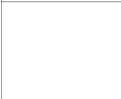
ACC. PICTO. DIANA FLAT HOMBRE + FLECHA ARRIBA