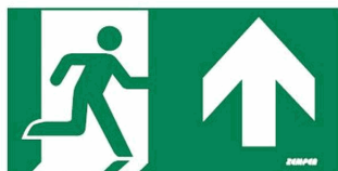
FLECHE HAUT Diana, Xéna, Arian IP42-IP65, Neptuno, Neptuno V, Saturno