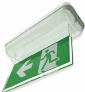
ACC. DIF. BANDE. ARIAN