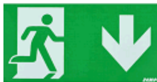
ACC. PICTO. DIANA FLAT HOMBRE + FLECHA ABAJO