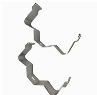
ACC. BRIDA FIJACION SUP. ARIAN