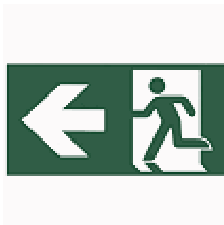
ACC. PICTO. DIANA FLAT HOMBRE + FLECHA IZQUIERDA