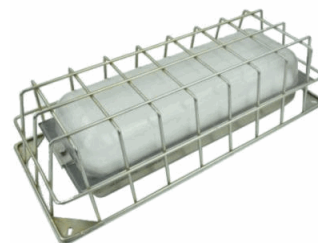
ACC. REJILLA PROTECCION ARIAN