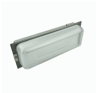
DIFUSEUR NEPTUNO VERRE