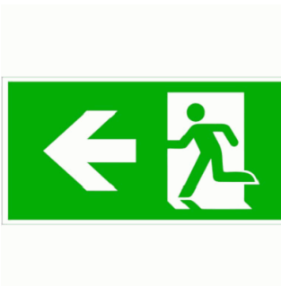
ACC. SATURNO PICT. F. IZQ PVC