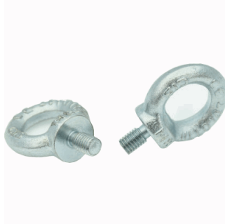
JUEGOS DE DOS CANCAMOS SATURNO