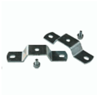
Bride de fixation