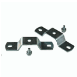
Bride de fixation