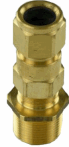
Presse étoupe Laiton 3/4" NPT pour câble armé