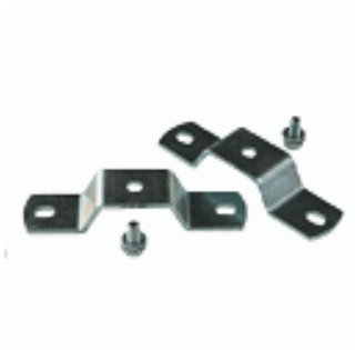
ACC. BRIDES DE FIXATION SATURNO PLAFOND