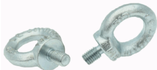
JUEGOS DE DOS CANCAMOS SATURNO