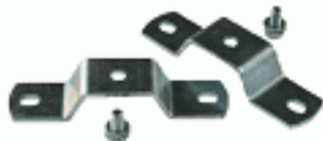
ACC. BRIDAS FIJACION SATURNO TECHO