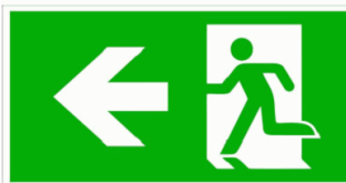
ACC. SATURNO PICT. F. IZQ PVC