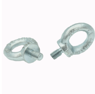
JUEGOS DE DOS CANCAMOS SATURNO