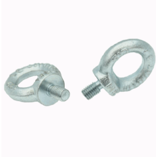
JUEGOS DE DOS CANCAMOS SATURNO