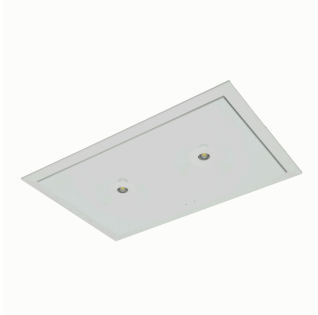
ACC. EMP. SPAZIO TOLEDO IP40 BLANCO TECHO