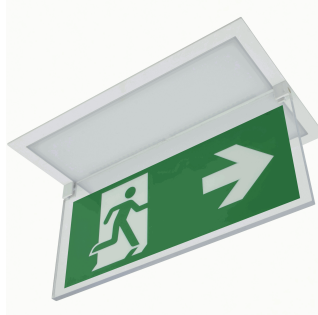
ACC. BANDE. EMP. SPAZIO TOLEDO BLANCO TRANSP