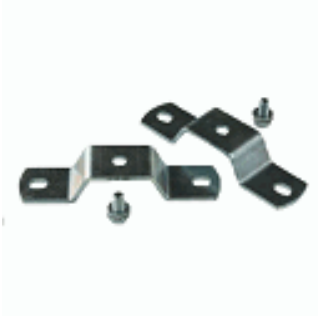
Bride de fixation