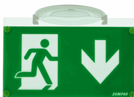
ACC. BANDE. EMP. SPAZIO LUZ BLANCO TECHO REDONDO