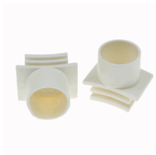
ACC. ENT. FLEX. SPAZIO LUZ BLANCO TUBO SUPERFICIE