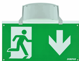
ACC. BANDE. SUP. SPAZIO LUZ BLANCO TECHO