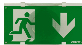
ACC. BANDE. SUP. SPAZIO LUZ BLANCO PARED