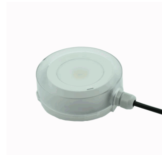
ACC. ENVOL. IP65 SPAZIO LUZ BLANCO