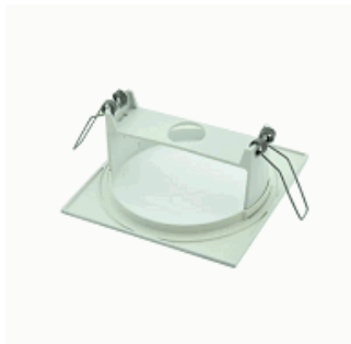
ACC. EMP. SPAZIO LUZ BLANCO TECHO CUADRADO