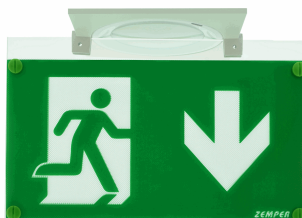
ACC. EMP. BANDE. SPAZIO LUZ BLANCO TECHO CUADRADO