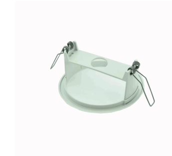
ACC. EMP. SPAZIO LUZ BLANCO TECHO REDONDO