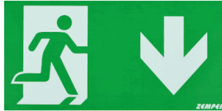
ROTULO * HOMBRE ABAJO *