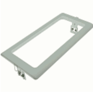
CJTO. ACC. EMP. TECHO VENUS BLANCO