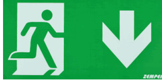
ROTULO * HOMBRE ABAJO *