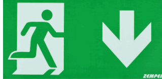
ROTULO * HOMBRE ABAJO *